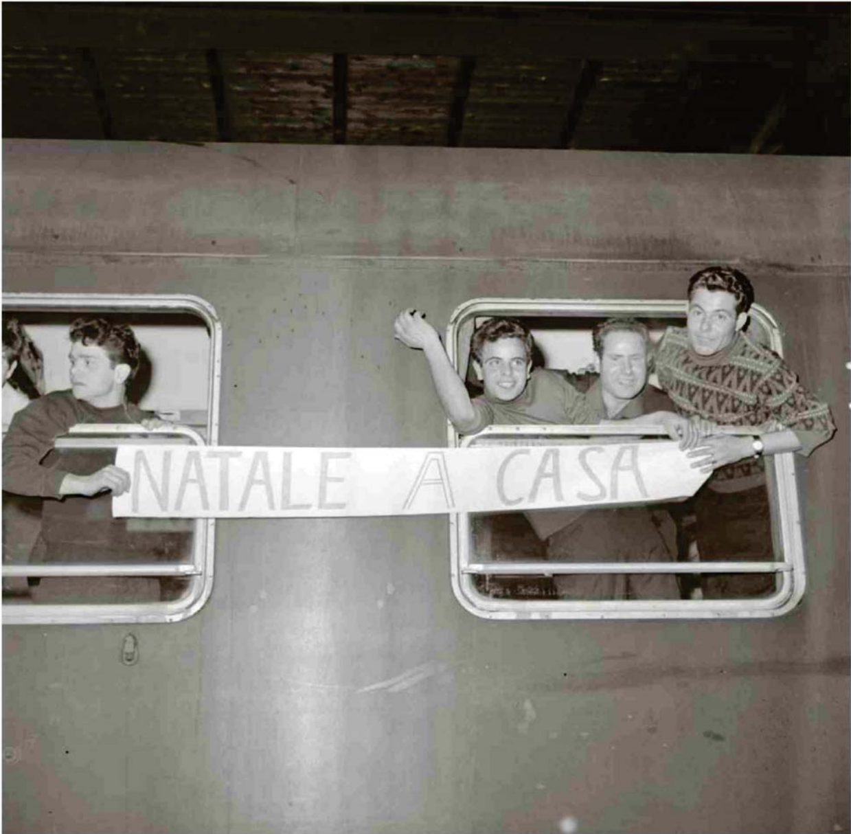
Italienische Fremdarbeiter fahren über Weihnachten nach Hause, 1964.