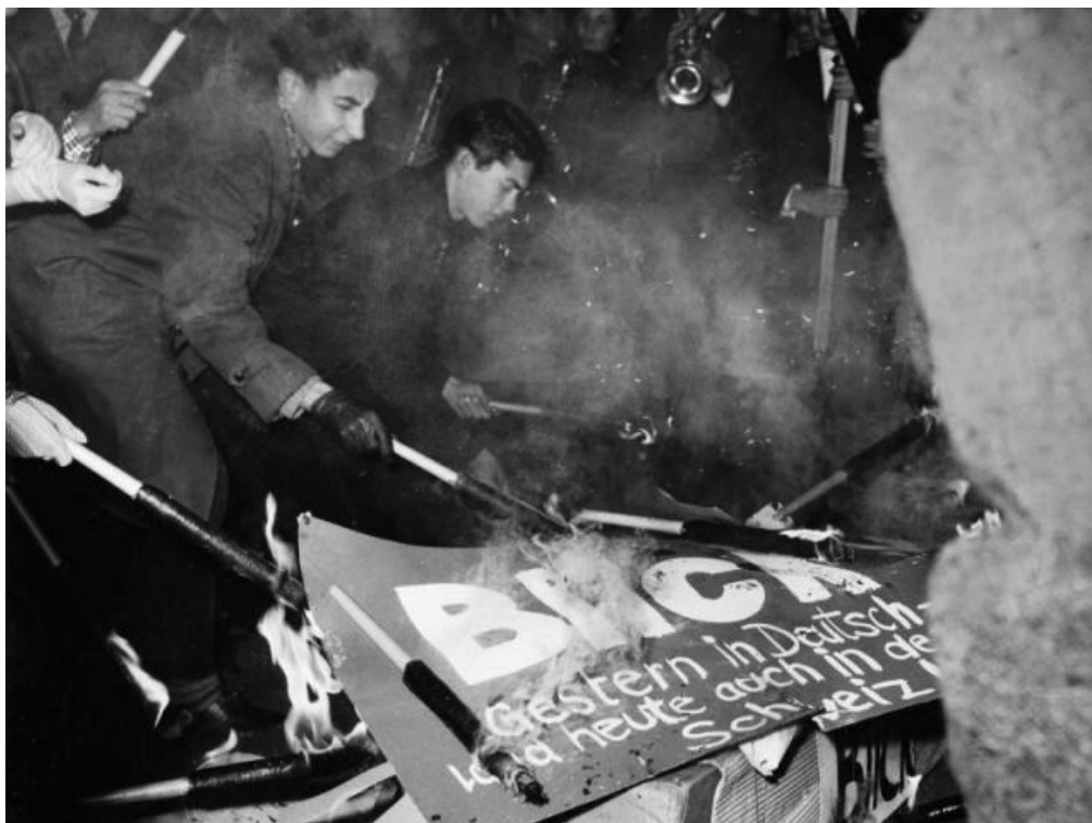
© Protest gegen den «Blick», Bern 1959. Foto: Beat Jost ©StAAG/RBA RBA3-1625_2

Di/Mi/Fr 11–18 Uhr, Do 11–20 Uhr, Sa/So 11–17 Uhr