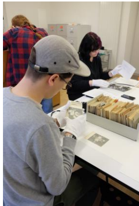
Die Studentinnen und Studenten des Seminars «fact & fiction» recherchieren im Schauarchiv des Ringier Bildarchivs, April 2018.