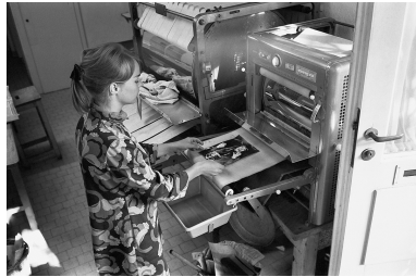
Eine Mitarbeiterin des Ringier Bilderdienstes bei der Vervielfältigung der Abonnentenbilder, Zürich, Oktober 1969.