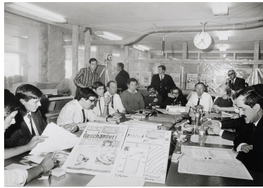
Redaktionssitzung beim Blick zur Planung der Aufmachung, um 1980.