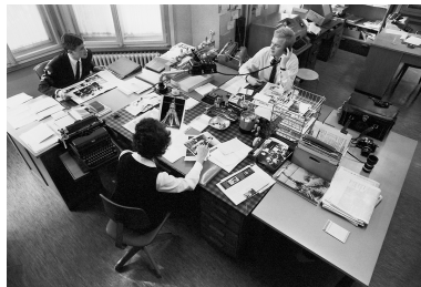
Im Büro des Ringier Bilderdienstes, Zürich, Oktober 1969.