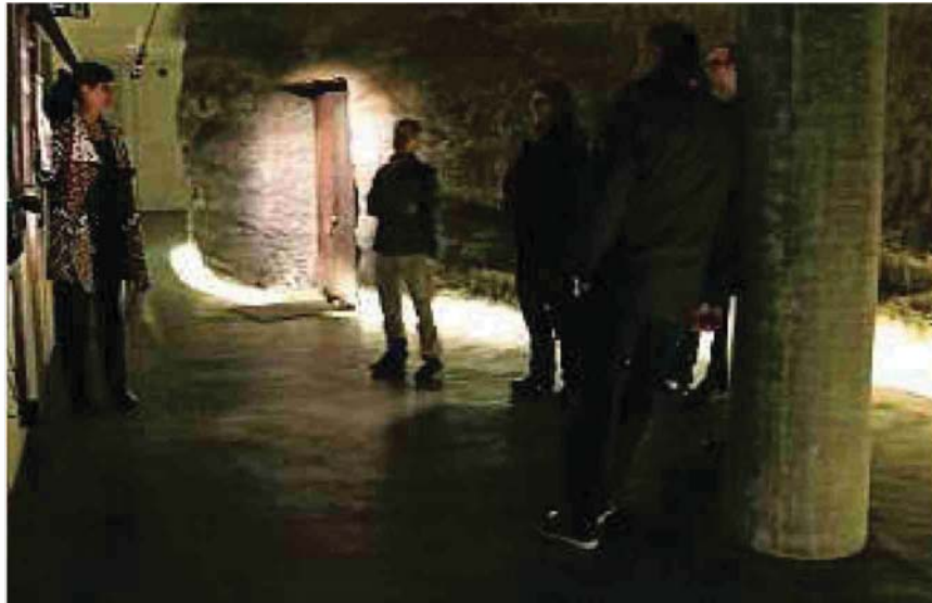
Interessiert lauschen die Besucher den Erzählungen an der Führung

Referenz: 68115374 Ausschnitt Seite: 2/2