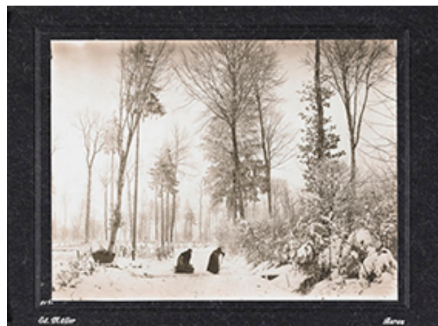
Aarau - Fotoausstellung von Eduard Müller