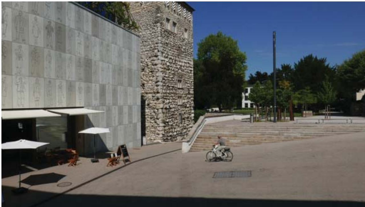
Stadtmuseum Aarau