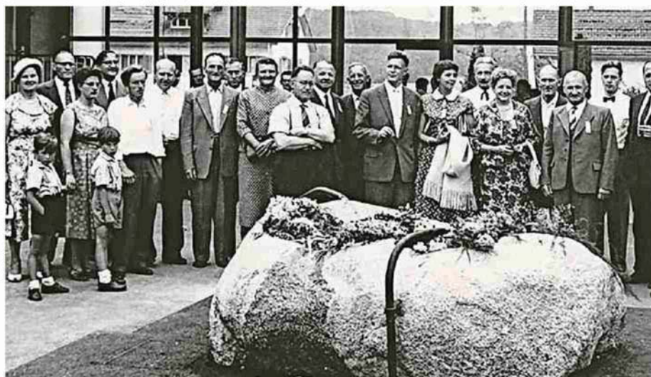
Bewegte Erinnerungen an die Brunnen-Einweihung von 1958.

Staffelbacher Filmtage: 21. Januar, 14 bis 18 Uhr; 22. Januar, 10 bis 16 Uhr; Alte Turnhalle.