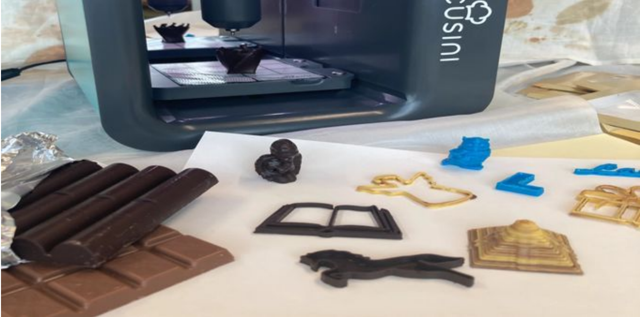
DigiSpace: ein digitaler Lernort im Stadtmuseum. - Stadtmuseum Aarau

Referenz: 86188606 Ausschnitt Seite: 2/2