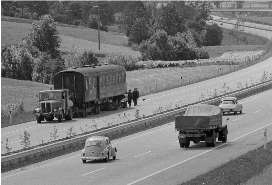
Transport des alten Speisewagens auf der Autobahn zum Bestimmungsort in Kölliken im Jahr 1967.

1972 mit dem Bau eines Restaurants ebenfalls ein Ende.