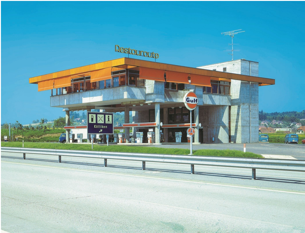
Die Autobahnraststätte Kölliken Nord in einer Aufnahme von 1971.