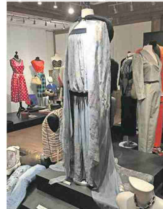
Ein Kleid von Yves Saint Laurent (ca. 1990).