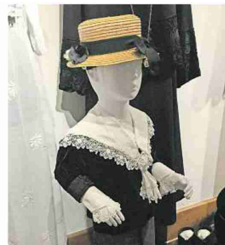
Es gab eine Zeit, da waren Rüschchen und Spitzen bei Kleidung für Buben gang und gäbe.