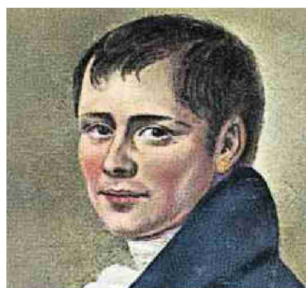
Heinrich von Kleist (1777–1811).

Auftrag: 1081688 Referenz: 83486817 Themen-Nr.: 800.003 Ausschnitt Seite: 3/3