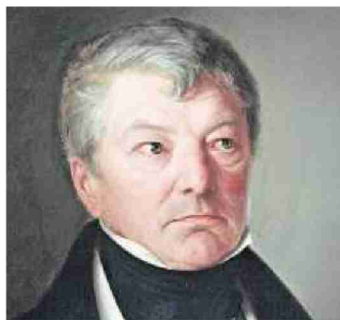
Heinrich Zschokke (1771–1848).