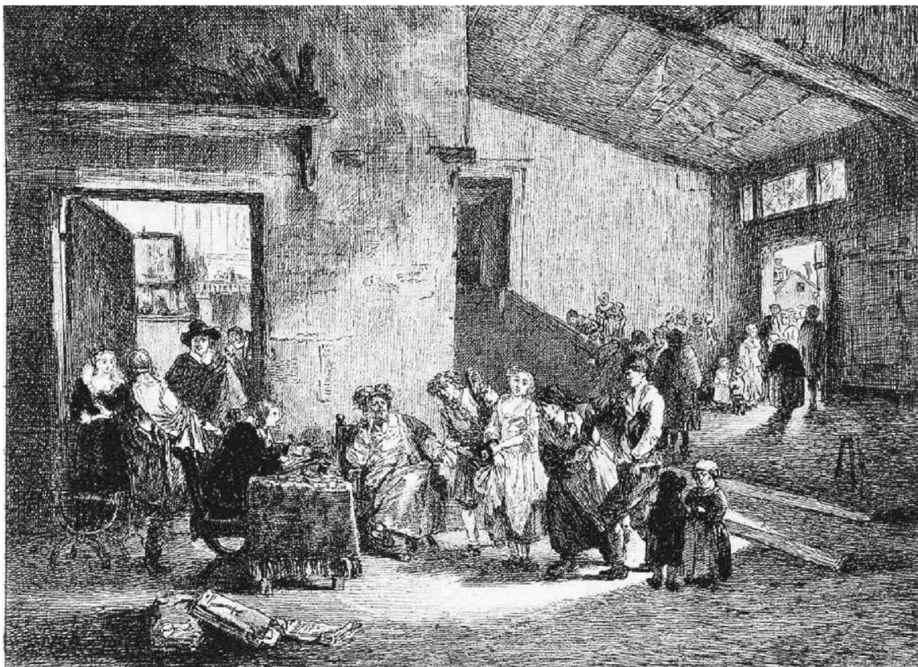
Inspirationsquelle: Den Stich «Le jeune ou la cruche cassée» erwähnt Kleist im Vorspiel seines Lustspiels.

Der für Aarau so prägende Publizist und Politiker Heinrich Zschokke (1771-1848) war in vielerlei Hinsicht ein Geburtshelfer von Heinrich von Kleists Schulklassiker «Der zerbrochene Krug». Eine Inszenierung des Stückes gibt's heute Abend in der Bühne Aarau zu sehen.